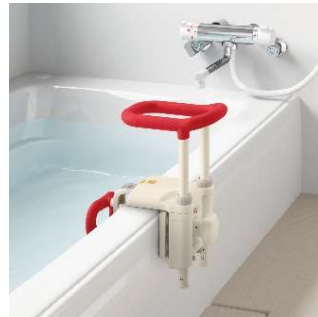
浴槽手すりUSTシリーズ

浴槽への出入りをサポートする手すりです。 工具不要でスピーディに取り付けできます。