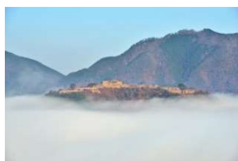
雲海と竹田城跡 この景色が見たかったです

朝5時、まだ暗いなか立雲峡へ向かいました。「天空の城」と例えられる、雲海に浮かぶ竹田城跡を見るため山を登りましたが、残念ながら雲海は見られませんでした。しかし、展望台から竹田城跡を望むことはできました。一度ホテルに戻り朝食をとり、その後竹田城跡に登りました。石垣が当時のまま崩れずに完全に残っていることに感心しました。