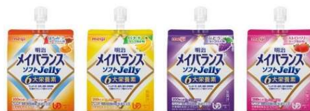
少量で高エネルギー